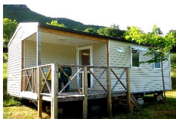
DIMENSION : 7,32 x 4,00