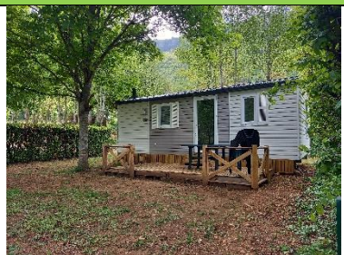
DIMENSION : 7.20 x 4,00