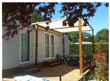
DIMENSION : 7.85 x 4,00