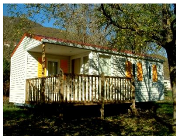
DIMENSION : 7,80 x 3,80