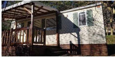
DIMENSION : 8,00 x 4,00