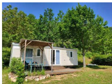
DIMENSION : 8.60 x 3,00